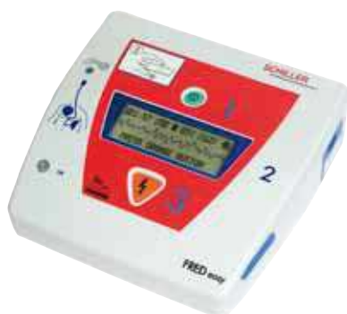
FRED easy con uso manual