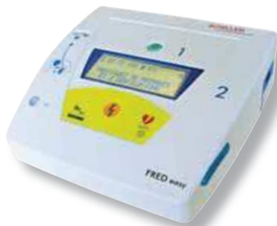
FRED easy completamente automático